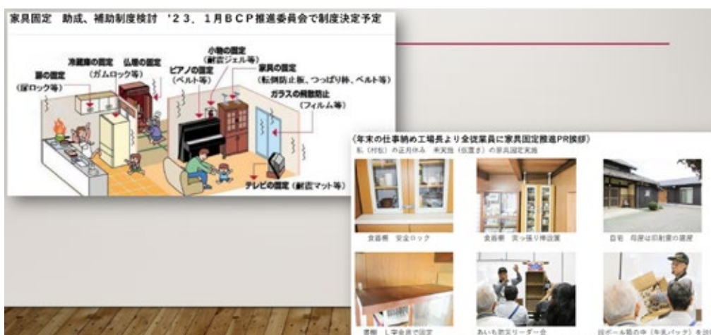
図3 日比野工業株式会社での取り組み

深田電機株式会社では、「あなたの命を守るLCP(生活継続計画)プロジェクト」を立ち上げ、まずは寝室の家具固定及び窓ガラスの飛散防止対策を実施するとともに、玄関までの避難経路の確保を進めた。また、併せて従業員へ耐震粘着マットを無償で配布し、自宅内の家具固定に活用を案内した。これにより、深田電機株式会社では、寝室におけるLCP対策の取り組みが進むことが出来た。