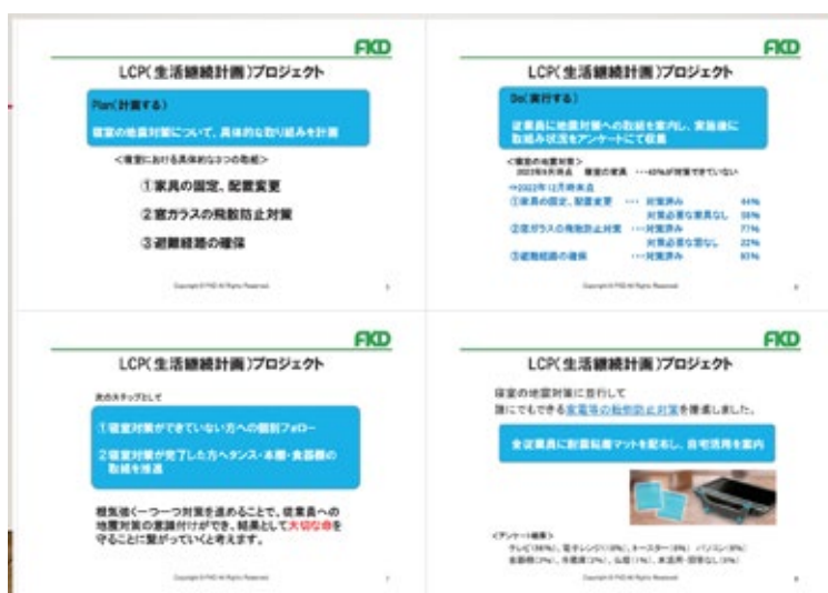
図4 深田電機株式会社での取り組み